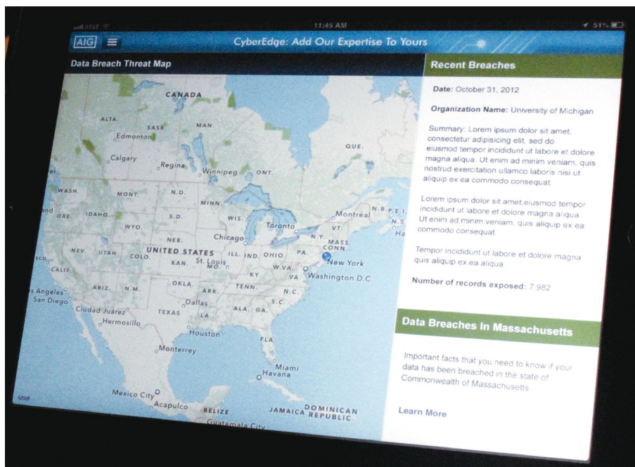
Um exemplo do Mapa de Ameaças de fuga de dados na aplicação CyberEdge para iPad.